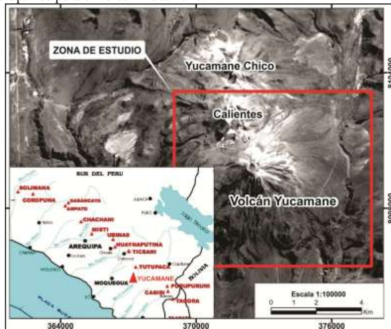
Figura 1. Mapa de localización de la zona de estudio

El objetivo del presente estudio es cartografiar localmente el depósito de caída, describir la estratigrafía del mismo, describir las características petrológicas de los productos eruptivos y finalmente estimar el volumen y la magnitud de este evento eruptivo. Este estudio es de fundamental importancia para determinar las características propias de este evento volcánico, la cual representa uno de los principales escenarios eruptivos para el volcán Yucamane.