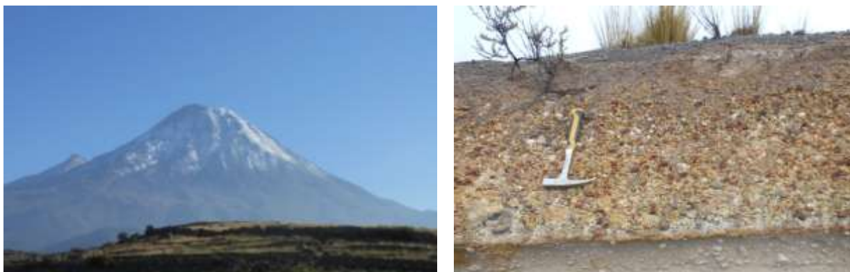
Figura 2. (a) Flanco sur del estratovolcán Yucamane, (b) Caída de tefra en la parte oriental del edificio.

Los estudios geológicos que están siendo realizados en este volcán permiten indicar que el Yucamane (Figura 2a) es un edificio relativamente joven, cuya parte superior (Yucamane II, Rivera et al., 2014) debe tener una edad Holocénica. Esta estimación está basada en ausencia de erosión glacial importante en la parte superior del cono y sería corroborada por dataciones radiométricas en curso. Por otro lado, los estudios tefrocronológicos señalan que durante la época post-glacial (post-LGM, i.e. < 18-24 ka), se han identificado al menos 4-5 erupciones explosivas importantes, cuyos depósitos de tefra se encuentran distribuidos en la parte oriental y sur-oriental del edificio. El depósito más reciente de esta secuencia aflora muy bien en la parte oriental y suroriental del edificio (Figura 2b) y es el objeto del presente estudio.