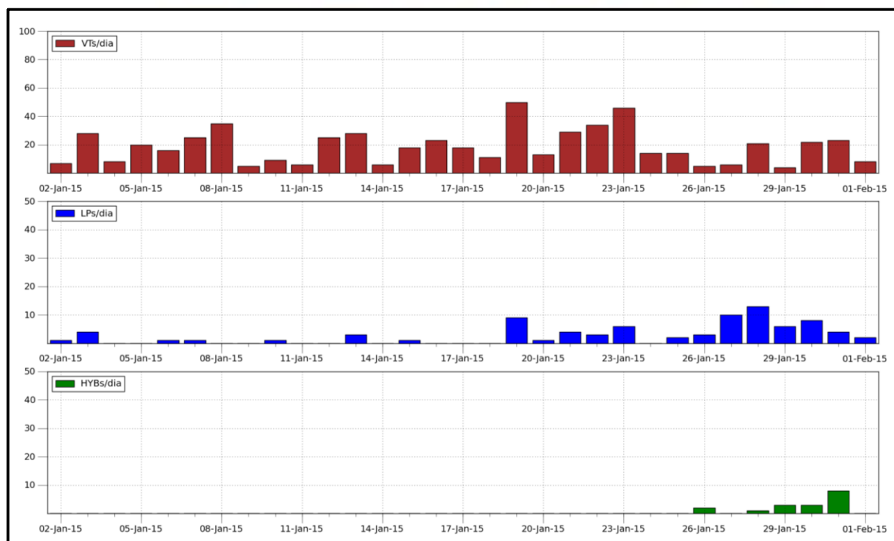
Figura 1.1. Cuadro estadístico de la actividad sísmica del volcán Misti, registrado entre los días 02/01/2015 y 01/02/2015. LP: sismo de largo periodo, asociado a la circulación de fluidos. VT: sismo volcano-tectónico, asociado al fracturamiento de rocas. HYB: sismo híbrido, asociado al ascenso de magma.