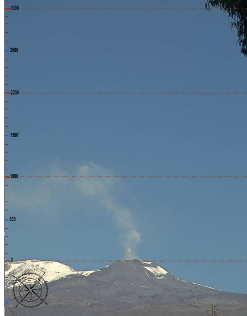
IMAGEN DE MONITOREO VISUAL EN TIEMPO REAL