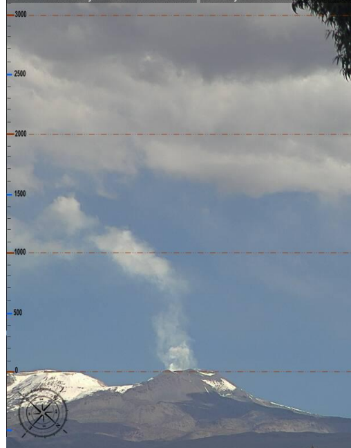
Imagen de monitoreo visual en tiempo real (23.05.16)