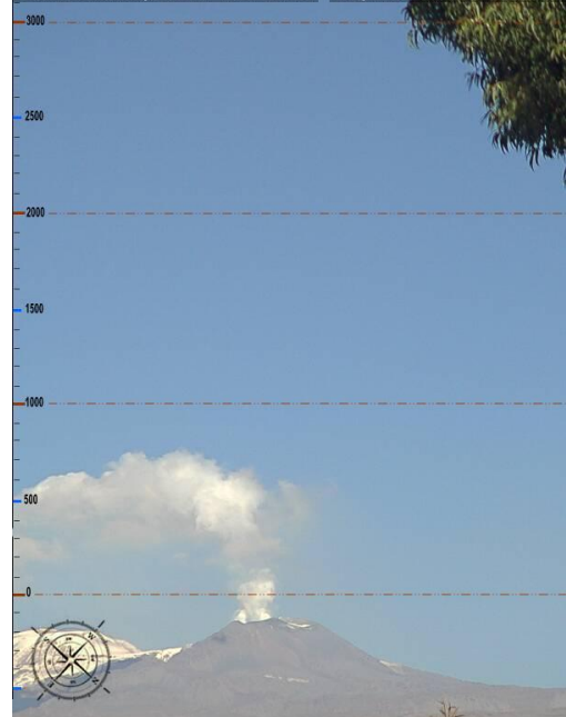
Imagen de monitoreo visual en tiempo real (15.06.16)