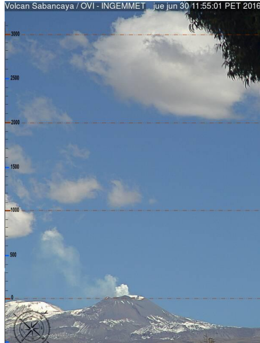
Imagen de monitoreo visual en tiempo real (30.06.16)