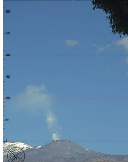
Imagen de monitoreo visual en tiempo real (10.07.16)

Volcan Sabancaya / OVI - INGEMMET dom jul 10 12:06:32 PET 2016