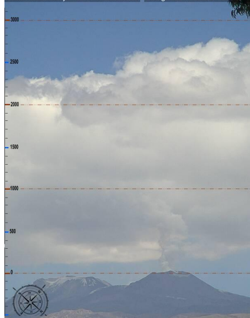
Imagen de monitoreo visual en tiempo real (26.08.16)