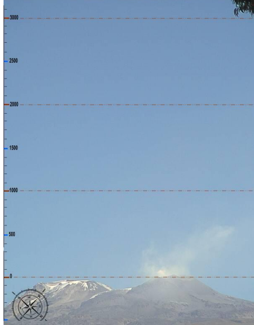
Imagen de monitoreo visual en tiempo real (29.08.2016)