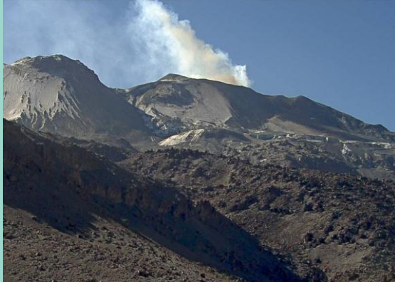
Imagen de monitoreo visual en tiempo real (11.09.2016)

Volcan Sabancaya / OVI - INGEMMET dom sep 11 15:17:33 PET 2016