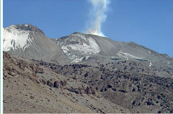
Imagen de monitoreo visual en tiempo real (20.09.2016)

Volcan Sabancaya / OVI - INGEMMET mar sep 20 10:50:34 PET 2016