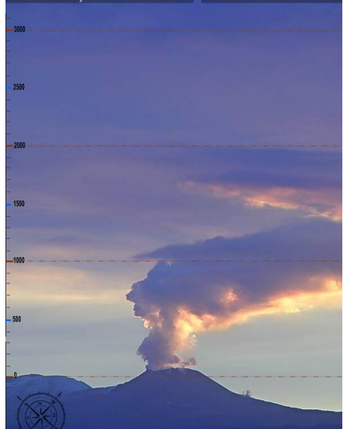
Imagen de monitoreo visual en tiempo real (06/11/2016)