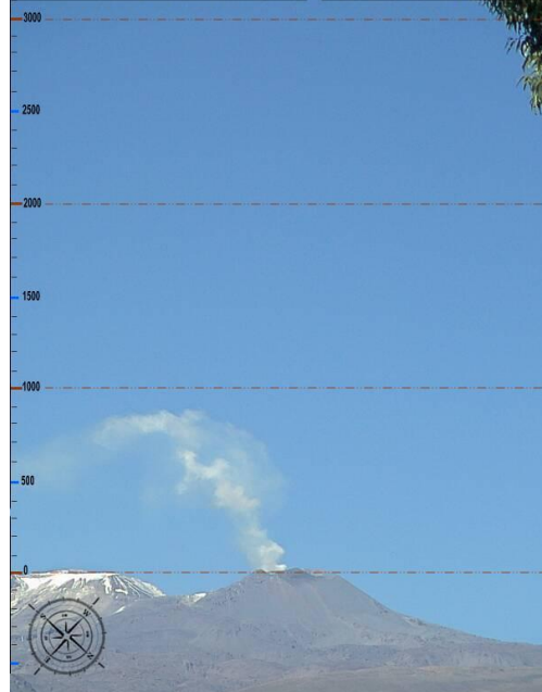
IMAGEN DE MONITOREO VISUAL EN TIEMPO REAL

Volcan Sabancaya / OVI - INGEMMET jue feb 4 09:35:02 PET 2016