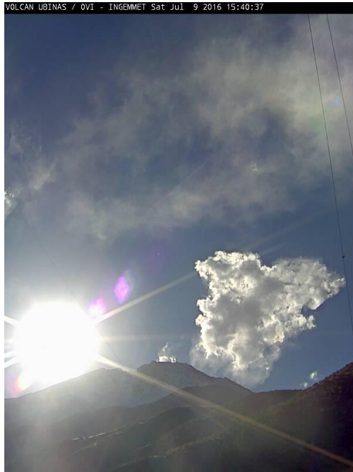
IMAGEN DE MONITOREO VISUAL EN TIEMPO REAL (09/07/16)