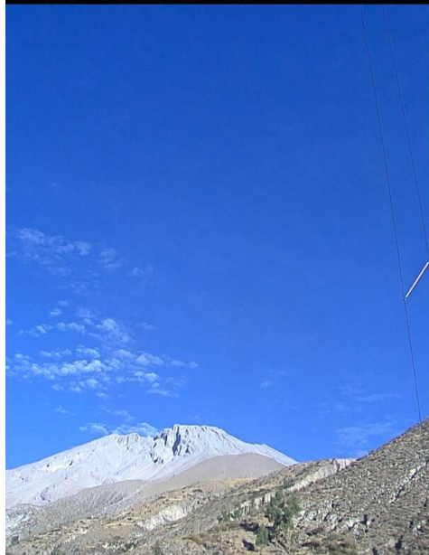
Imagen de monitoreo visual en tiempo real (10/12/2016)