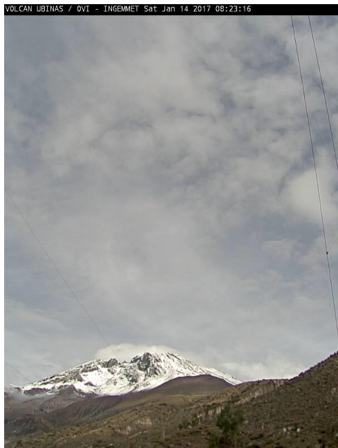
Imagen de monitoreo visual en tiempo real (14/01/2017)