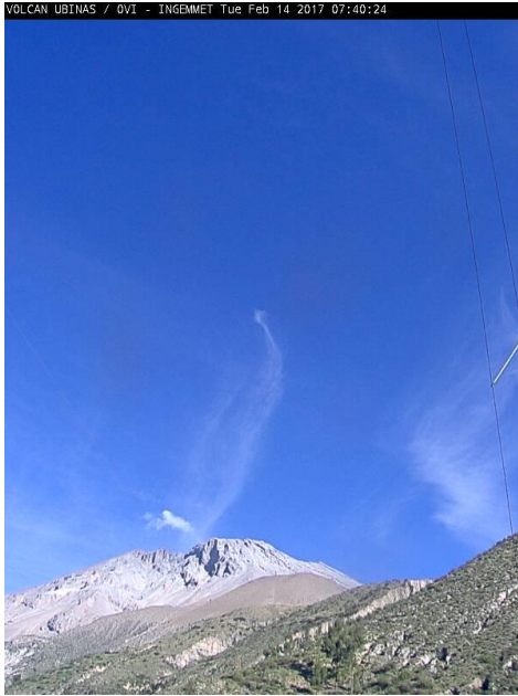
Imagen de monitoreo visual en tiempo real (14/02/2017)