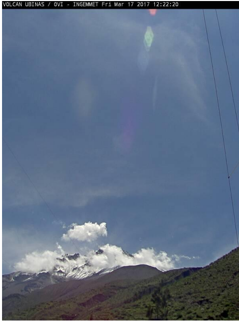
Imagen de monitoreo visual en tiempo real (17/03/2017)