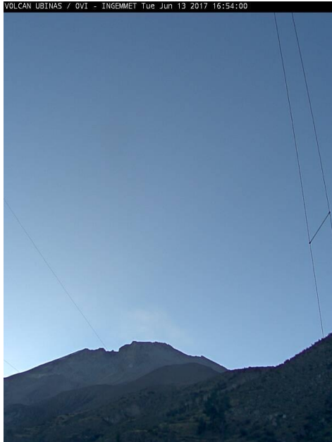
Imagen de monitoreo visual en tiempo real (13/06/2017)

RSUBN-25-2017/OVI-DGAR-INGEMMET Semana: del 12 al 18 junio de 2017