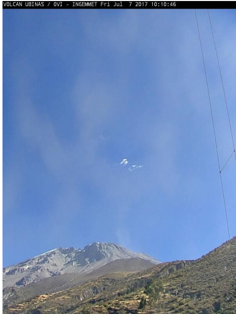
Imagen de monitoreo visual en tiempo real (07/07/2017)

RSUBN-28-2017/OVI-DGAR-INGEMMET Semana: del 03 al 09 julio de 2017