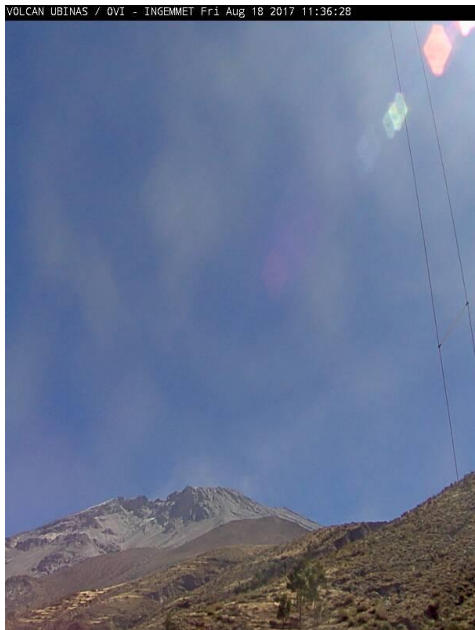
Imagen de monitoreo visual en tiempo real (18/08/2017)