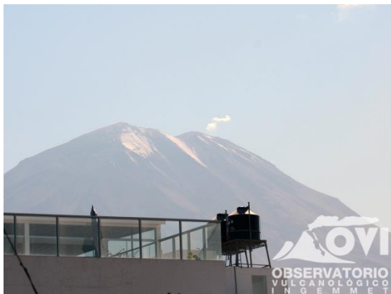
Imagen de monitoreo visual en tiempo real (28/08/2017)