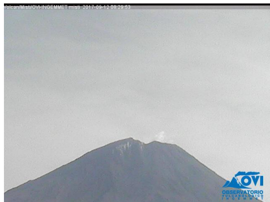
Imagen de monitoreo visual en tiempo real (12/09/2017)