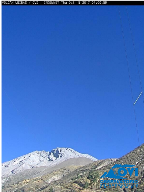
Imagen de monitoreo visual en tiempo real (05/10/2017)