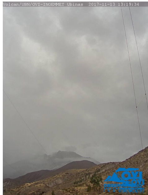
Imagen de monitoreo visual en tiempo real (13/11/2017)