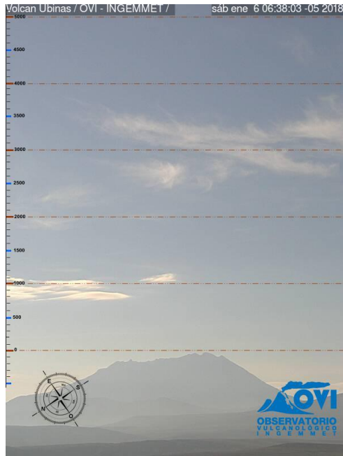
Imagen de monitoreo visual en tiempo real (06/01/2018)