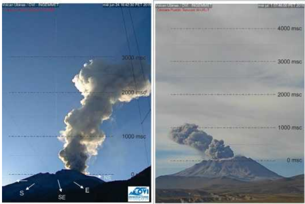
Imágenes de la emisión captadas por las cámaras de monitoreo de San Juan de Tarucani (Arequipa) y del poblado de Ubinas (Moquegua).