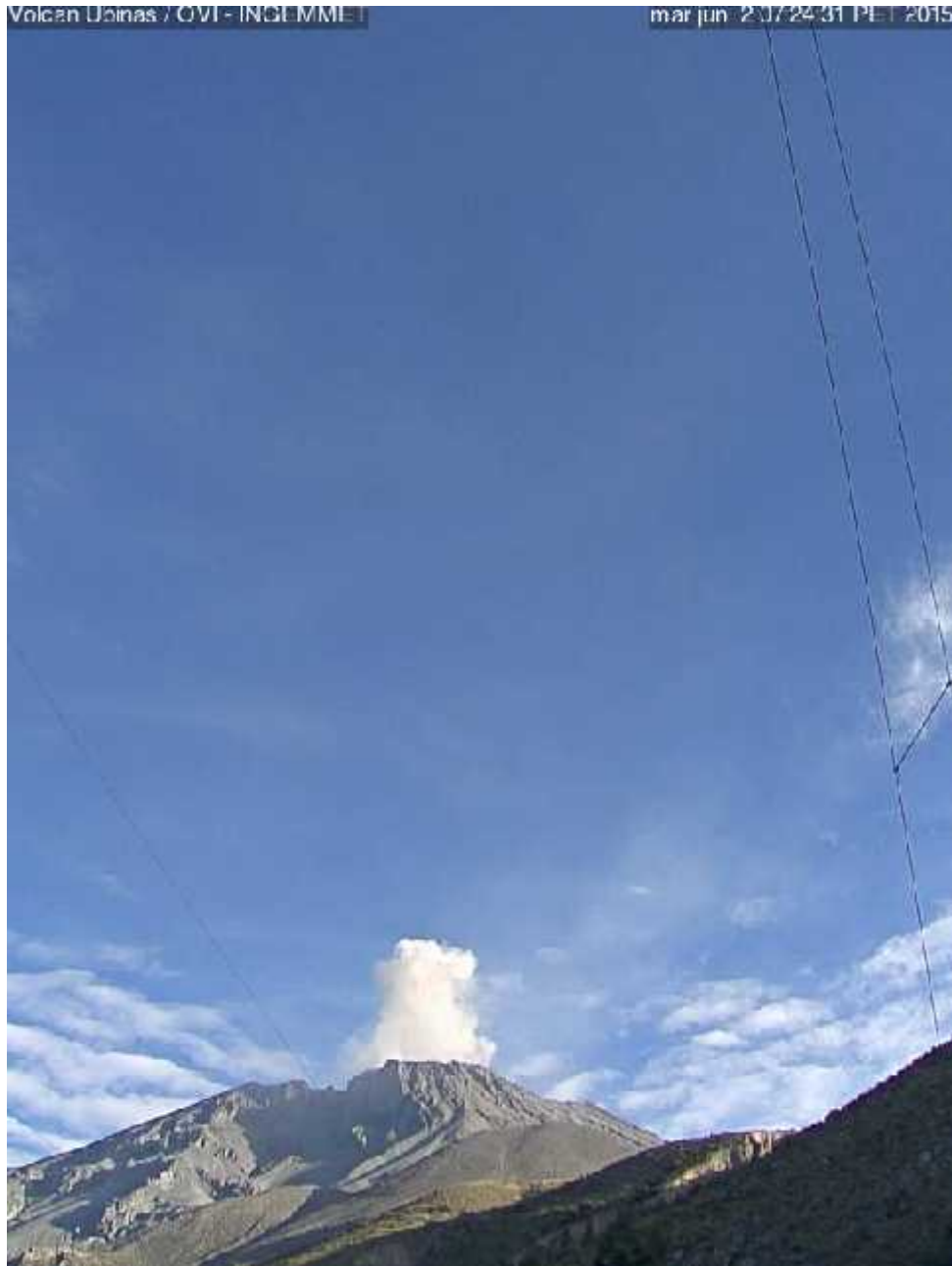
Cámara UBN (SE del cráter)

Nota: si desea más información puede acceder a la página web del observatorio: