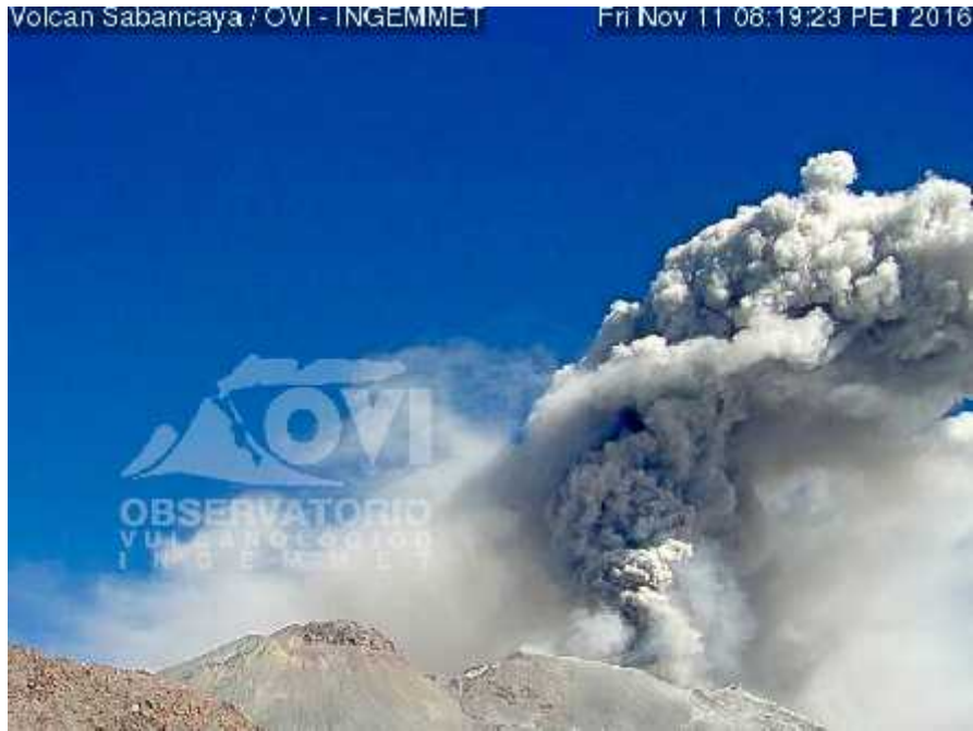
Imagen de la cámara Sabancaya2