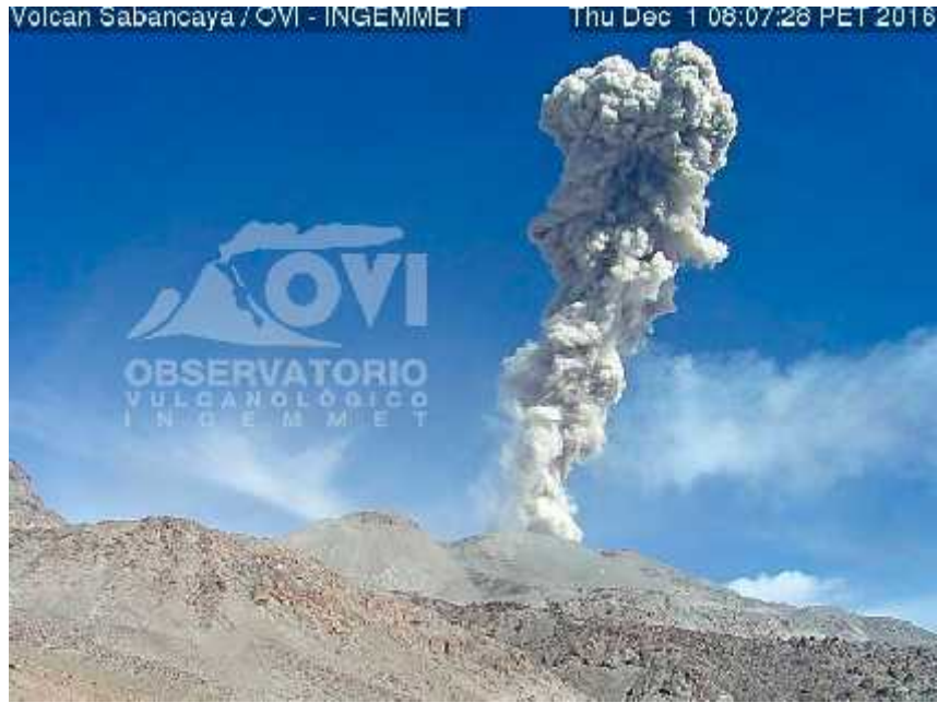
Imagen de la Cámara Sabancaya 2