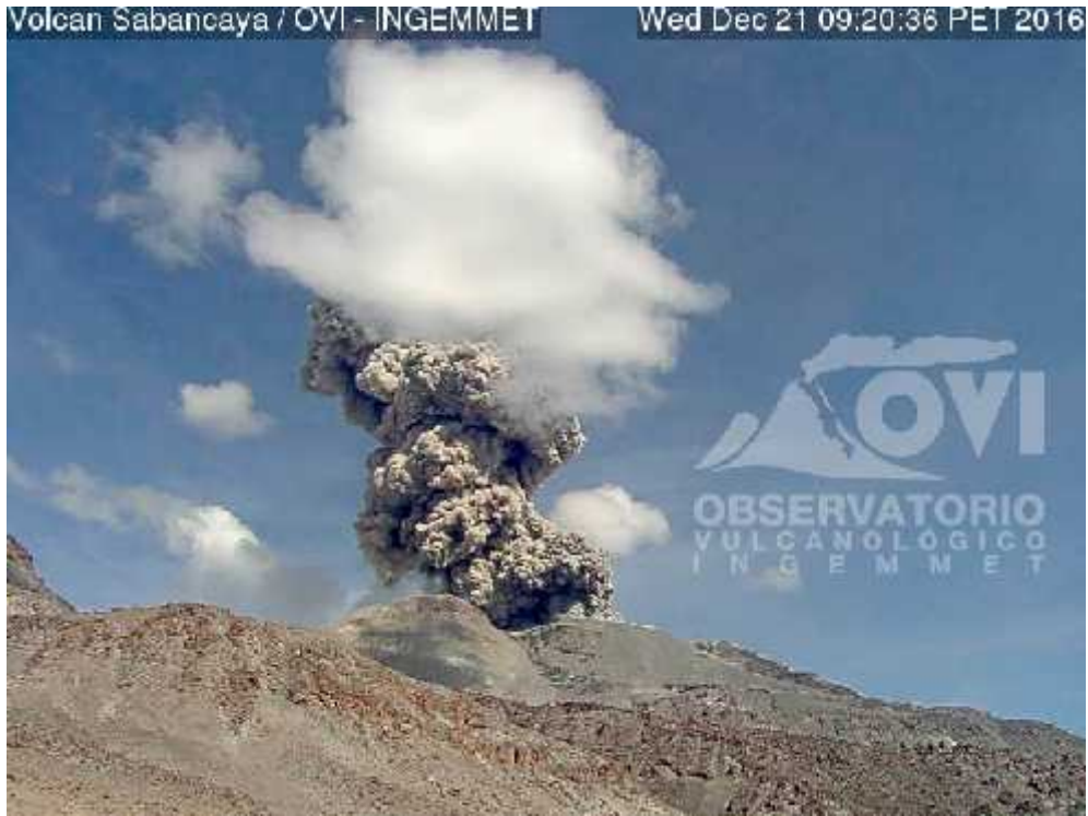
Imagen de la cámara sabancaya 2