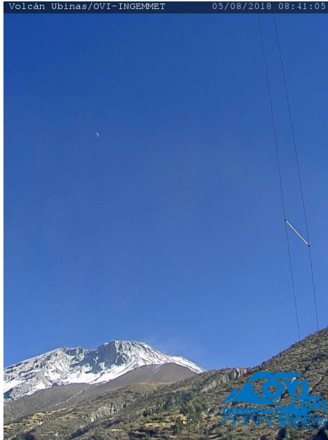
Imagen de monitoreo visual en tiempo real (05/08/2018).