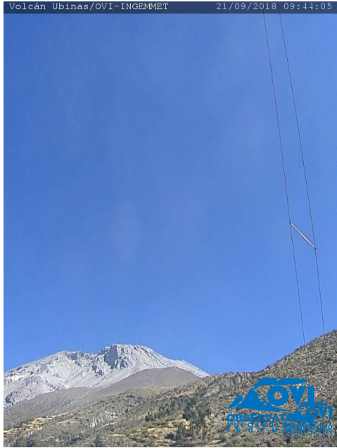
Imagen de monitoreo visual en tiempo real (21/09/2018).