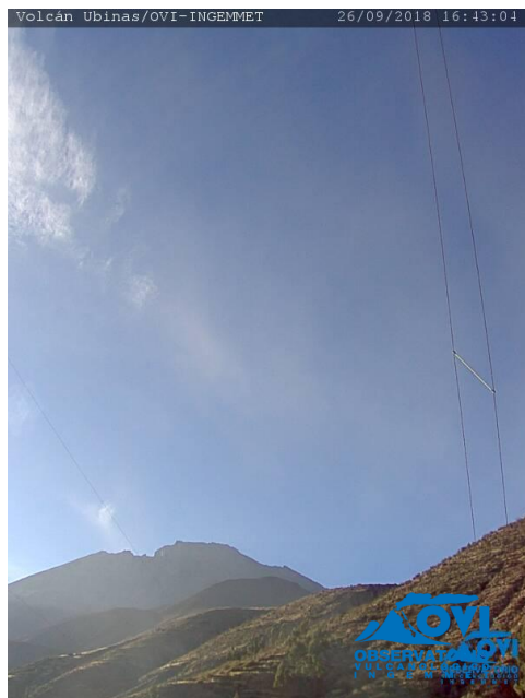
Imagen de monitoreo visual en tiempo real (26/09/2018).