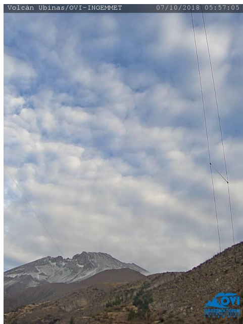
Imagen de monitoreo visual en tiempo real (26/09/2018).