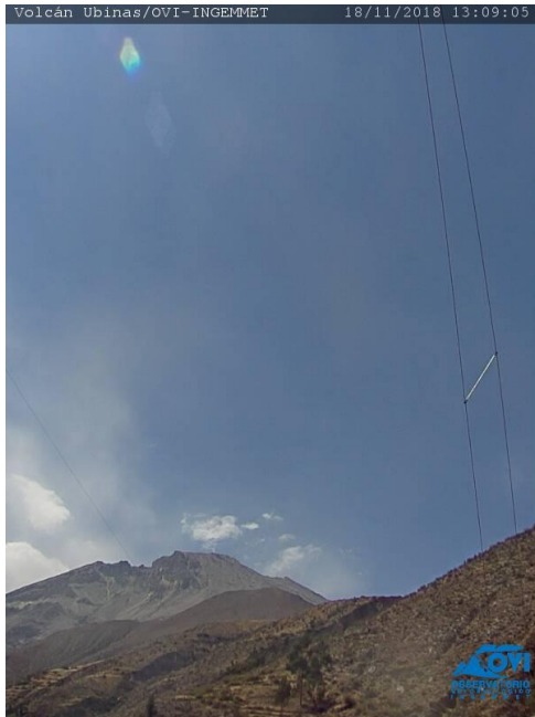
Imagen de monitoreo visual en tiempo real (18/11/2018).

RSUBN-46-2018/OVI-DGAR-INGEMMET Semana: del 12 al 18 de noviembre de 2018