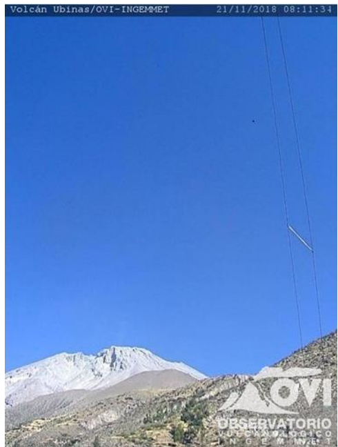
Imagen de monitoreo visual en tiempo real (21/11/2018).