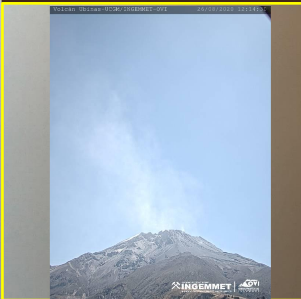
IMAGEN DE MONITOREO VISUAL EN TIEMPO REAL