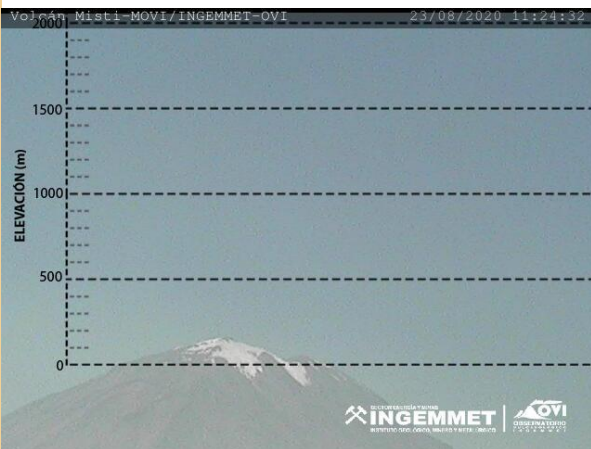
Imagen de monitoreo visual en tiempo real