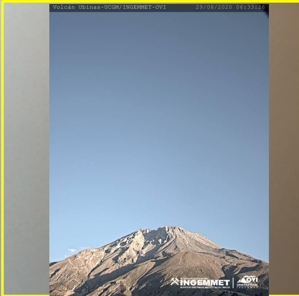
IMAGEN DE MONITOREO VISUAL EN TIEMPO REAL