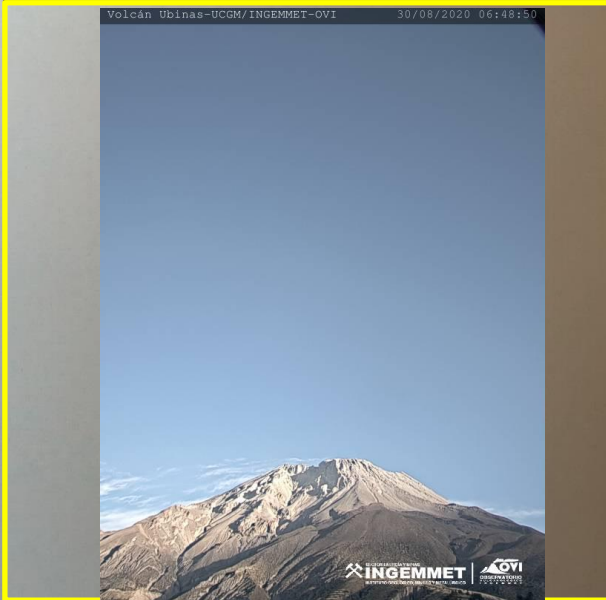
IMAGEN DE MONITOREO VISUAL EN TIEMPO REAL