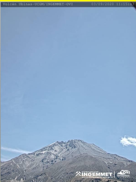
IMAGEN DE MONITOREO VISUAL EN TIEMPO REAL