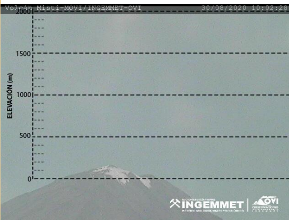
Imagen de monitoreo visual en tiempo real