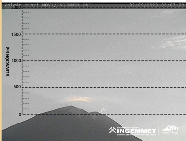
Imagen de monitoreo visual en tiempo real