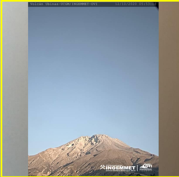
IMAGEN DE MONITOREO VISUAL EN TIEMPO REAL