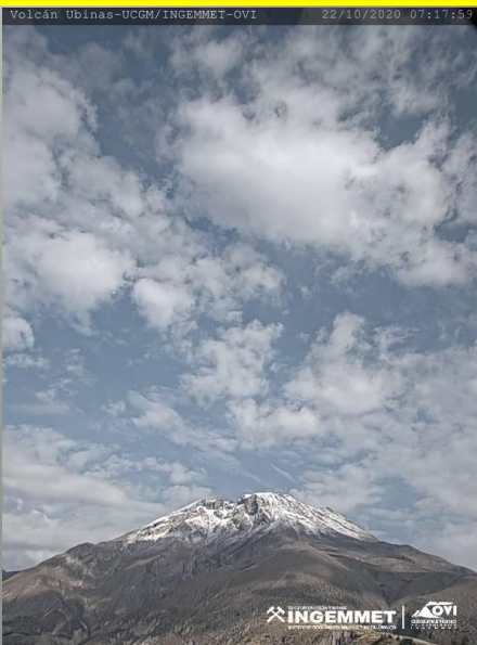
IMAGEN DE MONITOREO VISUAL EN TIEMPO REAL