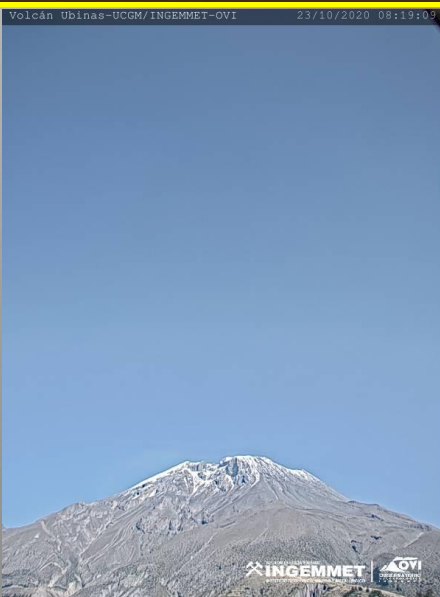
IMAGEN DE MONITOREO VISUAL EN TIEMPO REAL