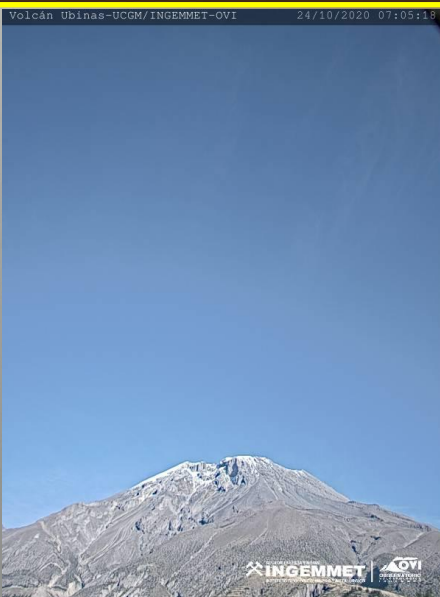
IMAGEN DE MONITOREO VISUAL EN TIEMPO REAL