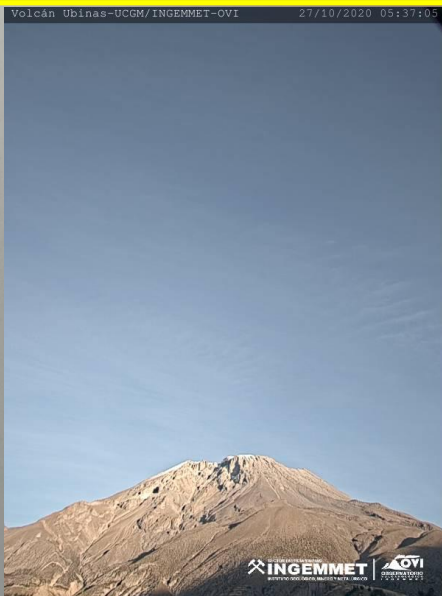
IMAGEN DE MONITOREO VISUAL EN TIEMPO REAL