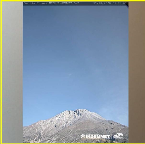
IMAGEN DE MONITOREO VISUAL EN TIEMPO REAL